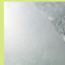
使用 後 (左下にメッキカバー塗布)