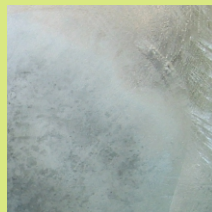
使用 前 (左下に[やけ]発生)

「メッキカバー」は亜鉛めっき表面の酸化とともに退色変化していき、徐々に光沢を失っていくように設計されているので、補修箇所があまり目立ちません。また、スプレーするだけで手軽にシルバー系のめっき色が得られるため、さまざまな場所に簡易めっき色スプレーとして利用できます。